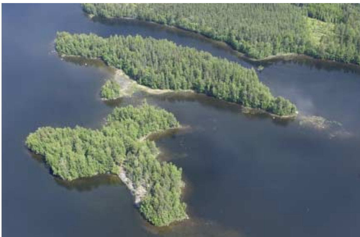
Katossaari ja Kypäikkö

Rantapelloilla peltoviljelyä, nurmetusta tai muuta vastaavaa maanpinnan käsittelyä ei saa ulottaa 10 m lähemmäksi rantaviivaa. Rantavyöhykkeelle on varmistettava riittävän suojavyöhykkeen muodostuminen.