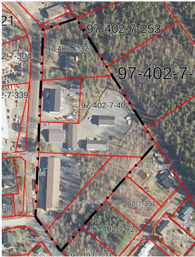
Kuva 2. Korttelin 5 suunnittelualan likimääräinen raja (musta) ja kiinteistörajat (punaisella).