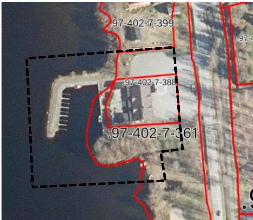
Kuva 1. Korttelin 15 suunnittelualan likimääräinen raja (musta) ja kiinteistörajat (punaisella).