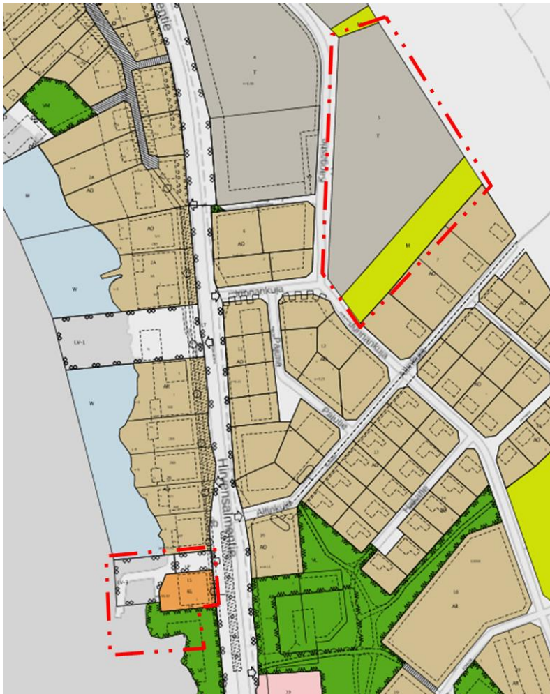
Kuva 6. Ote Hirvensalmen ajantasa-asekaavayhdistelmästä.