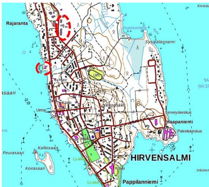
Kuva 1. Suunnittelualueiden likimääräinen sijainti punaisella katkoviivalla.

Korttelin 15 kaavamuutos koskee kiinteistöjä 97-402-7-361 ja 97-876-14-1. Osa-alueen pinta-ala on noin 1,0 ha.