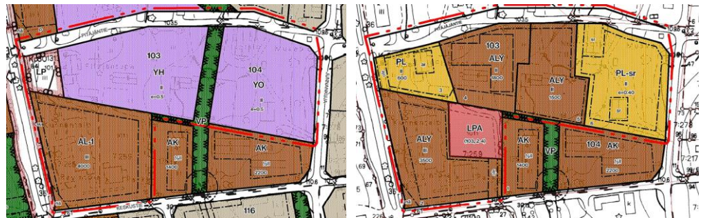
Kuva: Ote voimassa olevasta kaavasta ja ote kaavaluonnoskartasta

Kaava-asiakirjat pidetään nähtävillä 24.8. – 25.9.2017 välisellä ajalla.