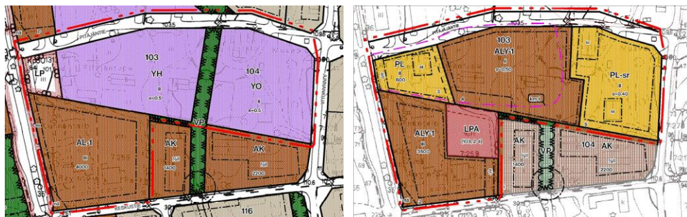
Kuva: Ote voimassa olevasta kaavasta ja ote kaavaehdotuskartasta

Kaavaehdotus pidetään nähtävillä 11.1. – 12.2.2018 välisellä ajalla.