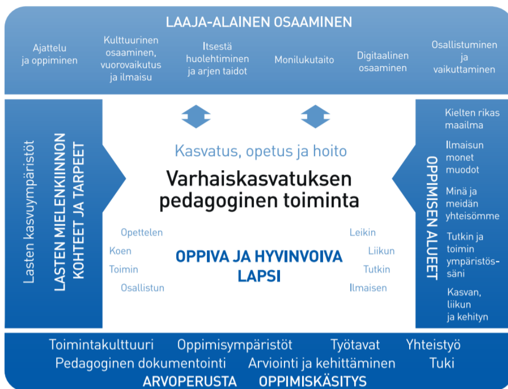
Kuvio1. Varhaiskasvatuksen pedagogisen toiminnan viitekehys

Varhaiskasvatuksen pedagogista toimintaa ja sen toteuttamista kuvaa kokonaisvaltaisuus. Tavoitteena on edistää lasten oppimista ja hyvinvointia sekä laaja-alaista osaamista (kuvio 1). Pedagoginen toiminta toteutuu lasten ja henkilöstön välisessä vuorovaikutuksessa ja yhteisessä toiminnassa. Lasten omaehtoinen, henkilöstön ja lasten yhdessä ideoima sekä henkilöstön suunnittelema toiminta täydentävät toisiaan. Varhaiskasvatuksen pedagoginen toiminta läpäisee kasvatuksen, opetuksen ja hoidon kokonaisuuden.