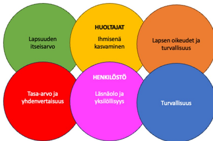
Arvokysely Varhaiskasvatukseen kevät 2024

Alkuvuodesta 2024 tehtiin varhaiskasvatuksessa arvokysely lasten huoltajille ja henkilöstölle. Huoltajien vastauksista nousi esille lapsuuden itseisarvo , ihmisenä kasvaminen sekä lapsen oikeudet ja turvallisuus . Henkilöstön tärkeimmäksi arvoksi nousi turvallisuus – sisältäen sekä fyysisen että psyykkisen turvallisuuden. Seuraavaksi esiin nousi tasa-arvo ja yhdenvertaisuus , läsnäolo sekä yksilöllisyys .